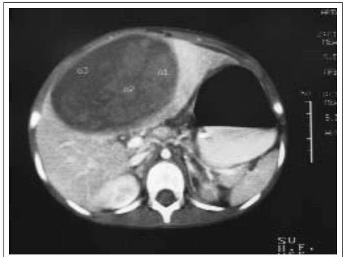
Figura 1. Tomografía axial computada (TAC) de abdomen que reporta lesión encapsulada dependiente de lóbulo hepático derecho e izquierdo compatible con absceso hepático amebiano.

Se inicia manejo con oxígeno, líquidos 2,500ml/SC/día y metronidazol 30 mg/kg/día, lo que disminuye en las primeras 24 h de manejo el aumento de volumen en pared abdominal derecha, el dolor abdominal y la distensión abdominal. El segundo día se agregan datos de dificultad respiratoria e hipo ventilación basal izquierda, con aumento de la transmisión de las vibraciones vocales, disminución de la movilidad diafragmática y se percute mate.