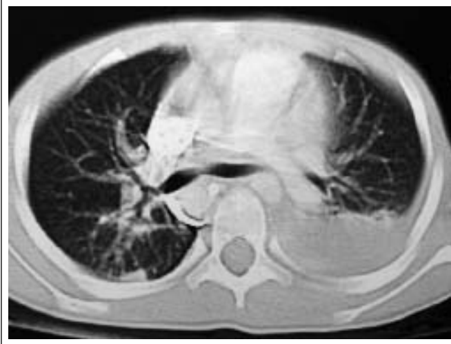
Figura 2. Tomografía axial computada (TAC) pulmonar que sugiere ruptura del absceso hepático amebiano al espacio pleural y donde se observa una consolidación basal pulmonar izquierda.

La evolución de la paciente mejora y se termina el tratamiento con metronidazol el día 14, así como seguimiento clínico a seis meses y por imagen, sin recidiva.