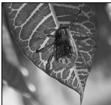
Imagen 1. Garrapata del perro Rhipicephalus sanguineus