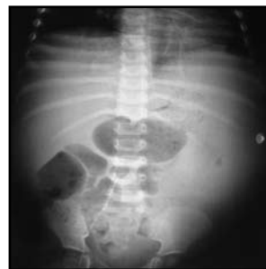
Imagen 2. Radiografía de abdomen que muestra desplazamiento de asas del intestino delgado por el crecimiento hepático y esplénico.