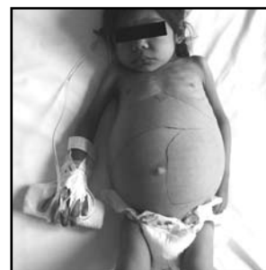
Imagen 1. Fotografía donde se muestra la gran hepatomegalia (12 cm) y esplenomegalia (22 cm) que llega hasta la cresta iliaca.

La leishmaniasis se trasmite por la picadura del flebotomo del género Phlebotomus en el viejo mundo y de géneros Lutzomyia y Psychodopygus en el nuevo mundo; solo la hembra trasmite la leishmaniasis. En el intestino del flebotomo se desarrollan los promastigotes y son