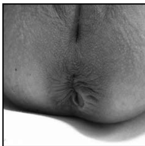
Imagen 4. Úlcera anal de dos centímetros de largo.

flagelados; al ser introducidos por la picadura del flebotomo al hospedero, en este caso al hombre, el parásito pierde el flagelo y se transforma en amastigote, los cuales se desarrollan intracelularmente en la célula del hospedero, se multiplican y posteriormente se diseminan al organismo a través del sistema linfático y vascular para invadir el sistema retículo endotelial, 4 hígado, bazo, médula ósea y nódulos linfáticos.