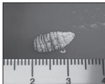
Figura 2. Larva que penetra la piel y causa las lesiones

La Cordylobia anthropophaga pertenece a la familia Calliphoridae . Su hábitat natural es el continente africano, en las regiones situadas al sur del Sahara, aunque parecen existir otros focos en la península Arábiga. Esta mosca es especialmente abundante en África occidental habiéndose descrito numerosos casos de infestación en viajeros procedentes de países como Senegal, Sierra Leona, Nigeria, etcétera. 7